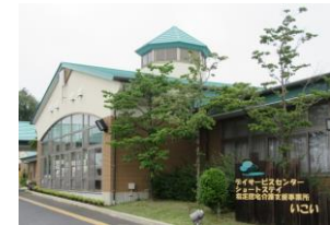
日当たりの良い、吹き抜けのある広いデイルーム。「ハナミズキ」と緑色の屋根が目印です。